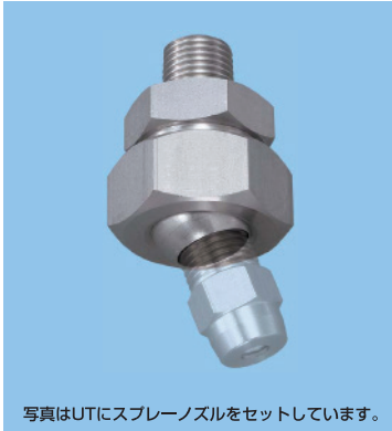
写真はUTにスプレーノズルをセットしています。