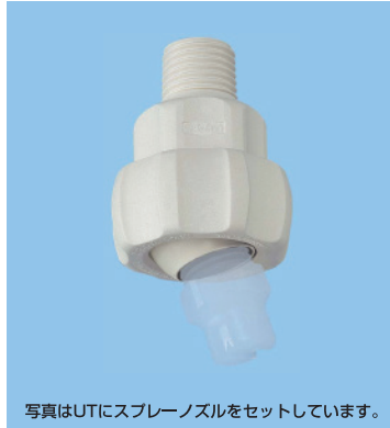
写真はUTにスプレーノズルをセットしています。