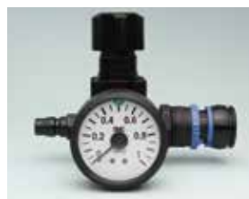
圧力調整用キット。 両端カプラと減圧弁をセット。

注) BIM**04タイプのノズルをご利用時は、圧力コントロールのためこちらが必要になります。